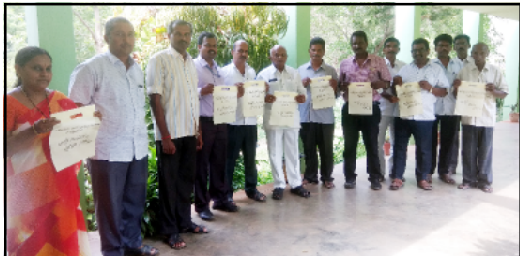
No Plastic usage pledge by Our college staff members