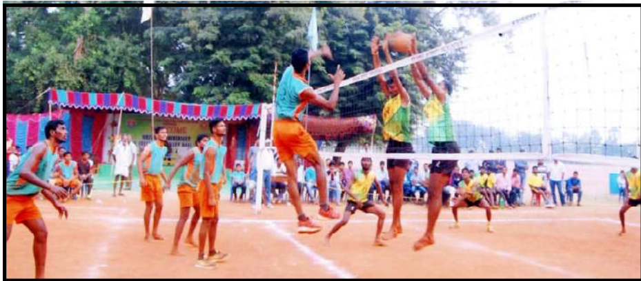
VOLLEY BALL ACTION PHOTO