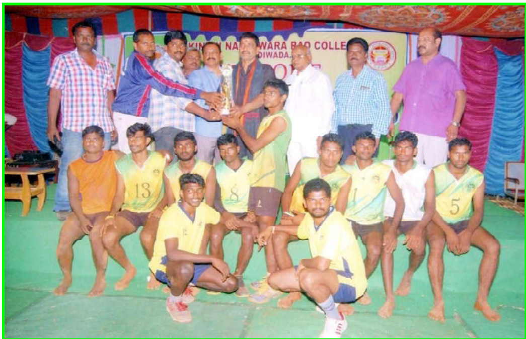
KUIC VOLLEYBALL RUNNERS TEAM