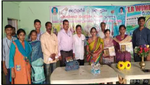
Our College Prize Winners in DYF held at KTR College, Gudivada