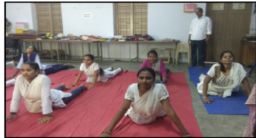
Yoga practise by our college girl students