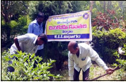
భూగర్భ జల సమృద్ధి, సుందరక్షణ కొరకు ఇంకుడు గుంతల నిర్మాణం మన కళాశాల ప్రీన్సిపాల్