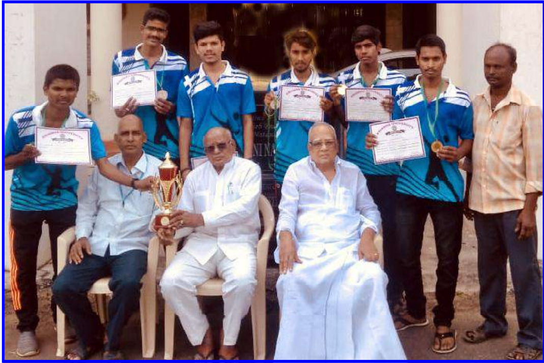
KUIC SHUTTLE BADMINTON WINNERS TEAM