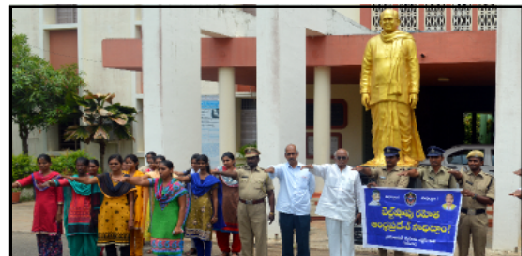
Pledge by Our college students to build 'Belt shops free A.P.'