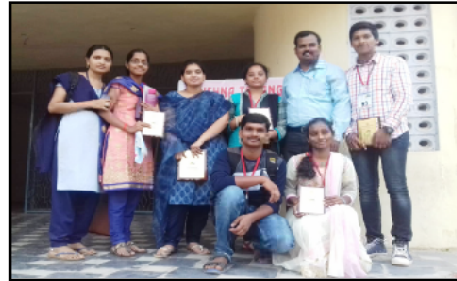
Prize winners of Krishna Tarang 2017 held at ALC Vijayawada