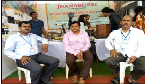
Principal and Staff in Jnanabheri Program held at IGMS Vijayawada