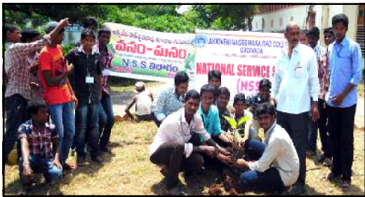
Our college NSS Volunteers plantaion in our college in Vanam-Manam programme