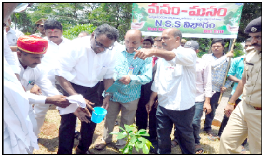
Former Supreme Court Chief Justice Jasti Chelameswar plantaion in our college in Vanam-Manam programme