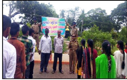
Awareness campaign on Drugs by Prohibition & Exice SI with our students