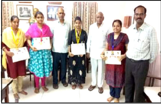
Prathibha Award Winners for the AY 2017-18 by Govt. of A.P.