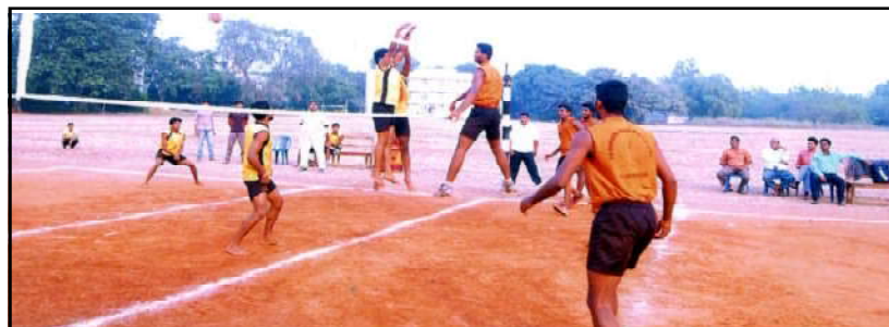
KUIC MEN VOLLEYBALL TOURNAMENT