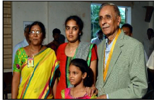
Rtd. D.G.P. T.S. Rao visited our college on the occasion of College Day Celebrations