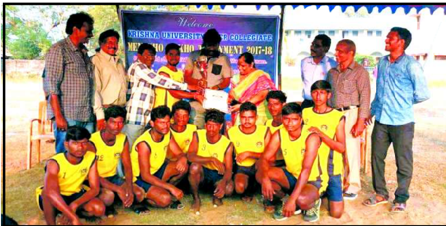
KUIC KHO KHO WINNERS TEAM