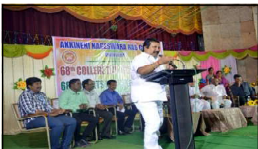
Famous Telugu movie singer Sri Nagur Babu (Mano) deliver the speech on College Day celebrations