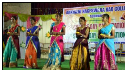
Dance performance by our college students